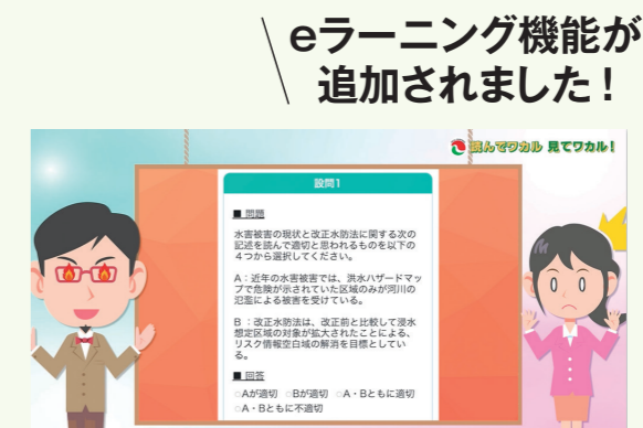
eラーニング機能のご紹介