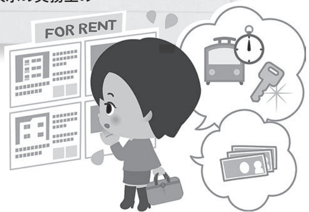
図1の「募集中」の部屋を広告するにあたってのポイントは次の3点です。

4LDKのマンションをシェアハウスとして貸し出す場合を例に考えてみます(図1)。4つの居室には他人同士が居住します(友人同士が共同で借りるわけではありません。貸主は4人の借主と賃貸借契約を結びます)。バス、トイレ、DK等は共用することになります。